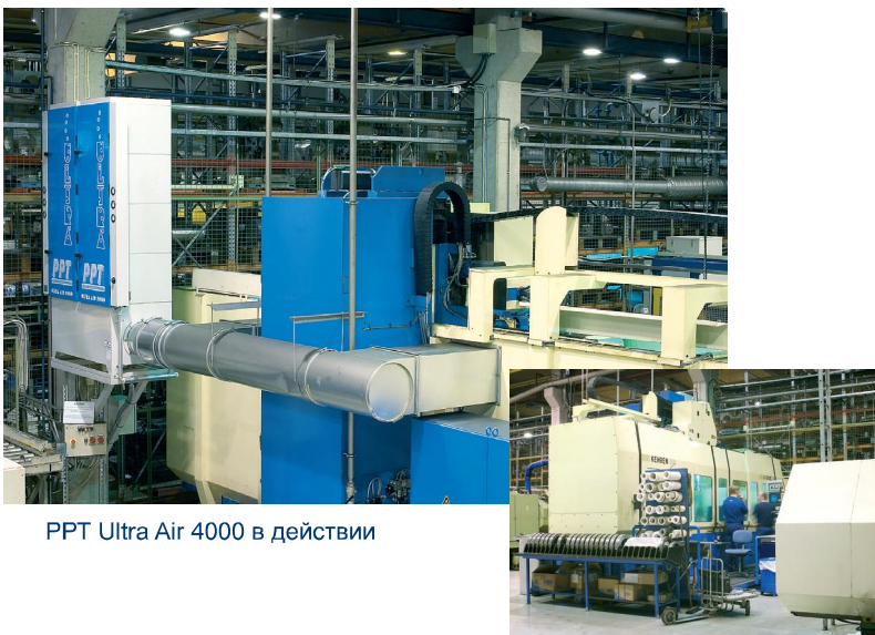
PPT Ultra Air 4000 в действии